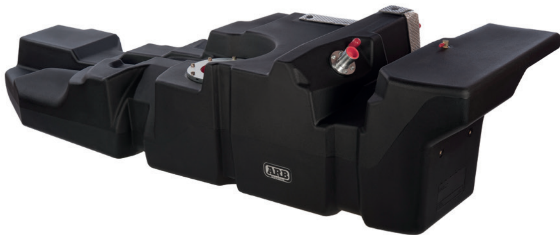
Бак ARB Frontier для HiLux